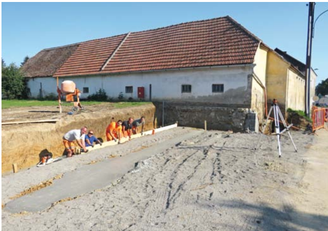
Hardegger Stadtnachrichten 2/2020

Nach den coronabedingten Verzögerungen beim Baubeginn konnte nun mit den Arbeiten beim Straßenbauprojekt Niederfladnitz begonnen werden. In einer ersten Bauphase zur Beseitigung der Engstelle entlang der B30 wurden zwei alte Keller im Ortsgebiet von der Gemeinde angekauft, abgerissen und verfüllt. Die Errichtung einer Stützmauer zum Anrainergrundstück, die Schaffung von zusätzlichen Parkplätzen für den Ortsbereich Niederfladnitz sowie die Verkabelungsarbeiten mit der EVN und die Verlegung der Ortsbeleuchtung durch die Gemeinde werden in einem weiteren Schritt erfolgen. Sämtliche Arbeiten werden in Zusammenarbeit mit der Straßenmeisterei Retz erledigt.