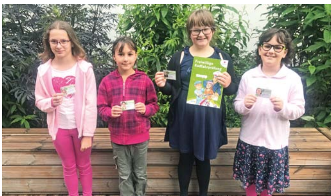
Hardegg Stadtnachrichten 2/2020

Als einzige Schulveranstaltung in Corona-Zeiten durfte die Radfahrprüfung stattfinden. Vier Mädchen unserer 4. Schulstufe nahmen an der Prüfung teil und sind nun stolze Besitzerinnen des Radfahrausweises. Alles Gute!