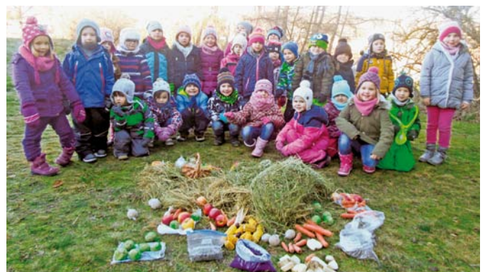
Das Kindergartenteam und die Kinder vom Kindergarten Pleissing wünschen allen Familien und GemeindegängerInnen

Schriftlich an die Stadtgemeinde Hardegg unter Anschluss eines Motivationsschreibens, eines Lebenslaufes und eines Strafregisterauszuges bis spätestens 31. Jänner 2018 (einlangend)!