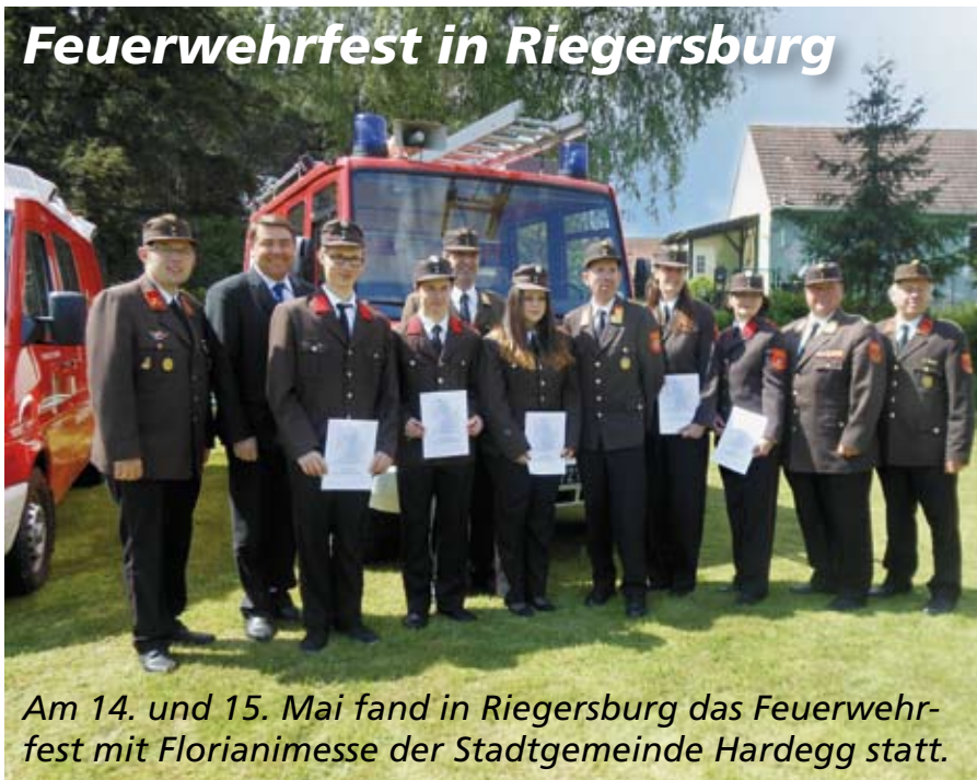
Am 14. und 15. Mai fand in Riegersburg das Feuerwehrfest mit Florianimesse der Stadtgemeinde Hardegg statt.