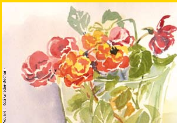
Aquarell: Rosi Griedler-Beckhank

Kultur•Punkt Hardegg: geöffnet 4. Mai bis 20. Oktober an Sa/So, Feiertagen. 📄→ www.kulturpunkt-hardegg.com