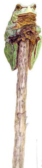
LAUBKROCH (Hyla arborea) 2.2.2019 Eber

Jahresausstellung gratis zu den Öffnungszeiten zu besichtigen im